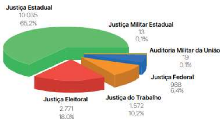
Figura 3: Unidades judiciárias de 1º grau, por ramo da justiça, em 2017

Os dados mais recentes do Relatório Justiça em Números (DPJ, 2018), reforçam a ideia de capilaridade das unidades judiciais exercida pela Justiça Estadual frente aos outros segmentos de Justiça. Na Figura 3, pode-se perceber o predomínio das 10.035 varas e juizados especiais da Justiça Estadual que estão inseridas em 2.697 comarcas e representam mais da metade da estrutura de atendimento do Poder Judiciário nacional. Em termos de representatividade, essas unidades judiciais estão presentes em cerca de 48,4% dos municípios brasileiros.